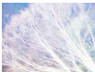
3. — I I 70259 type C print edition 10 307 x 410 mm ¥120,000 + tax