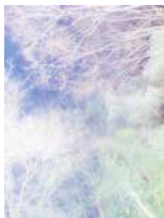
1. — I I 70261 type C print edition 10 1500 x 1125 mm ¥450,000 + tax