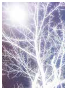
5. — I I 70281 type C print edition 10 290 x 217 mm ¥80,000 + tax