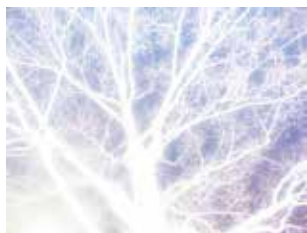
4. — I I 70244 type C print edition 10 307 x 410 mm ¥120,000 + tax