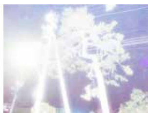
6. — I I 70276 type C print edition 10 307 x 410 mm ¥120,000 + tax