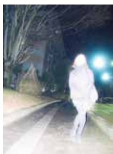
7. — I I 70262 type C print edition 10 290 x 217 mm ¥80,000 + tax